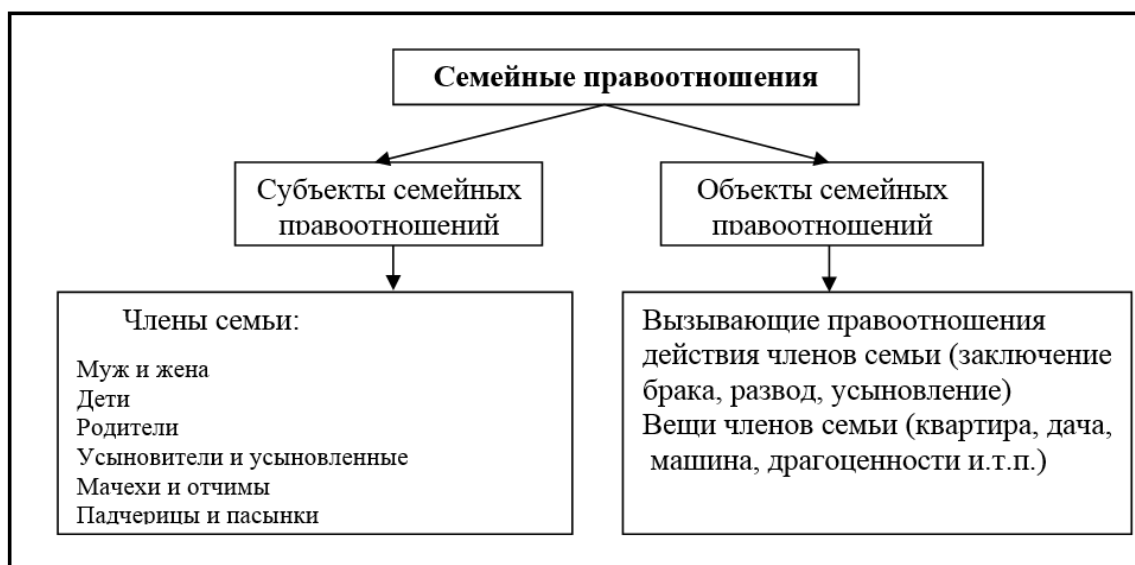
Рис. 1. – Семейные правоотношения

Субъектами семейного правоотношения являются лица, обладающие субъективными семейными правами и несущие субъективные семейные обязанности. Наличие связи между двумя элементами семейного правоотношения, т.е. между субъектами и их правами и обязанностями, подтверждает существование структуры правоотношения. Это имеет важное значение для практики, так как позволяет провести разграничение между субъектами правоотношения и другими лицами, участвующими в нем (рис. 1).