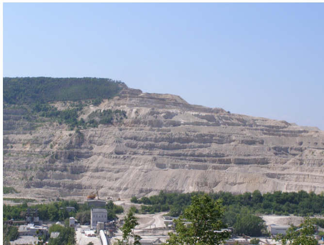
Рисунок 1 - Карьер в Яблоневоm овраге

Другой карьер "Яблоновское месторождение" является основной сырьевой базой Жигулевского комбината строительных материалов (рис.1).