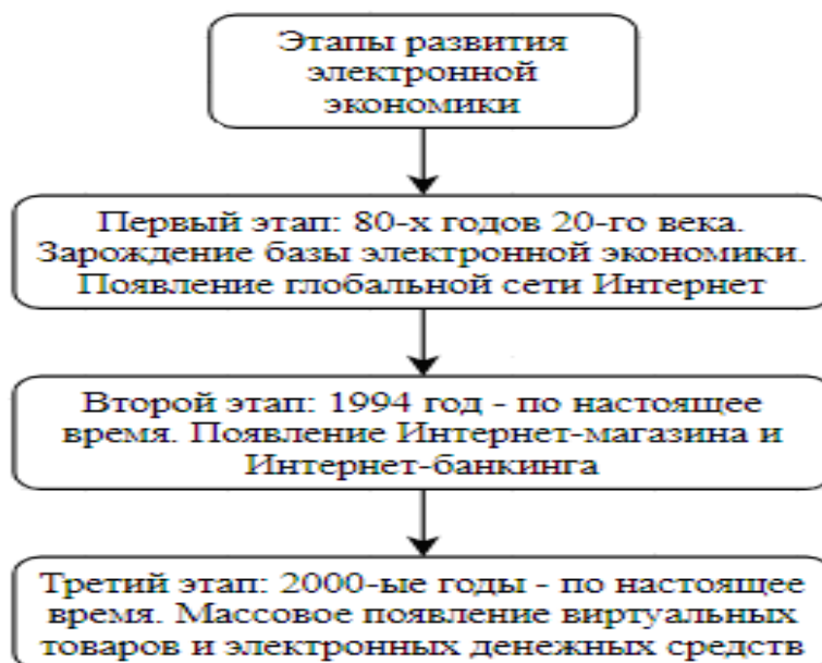
Рисунок 2. Этапы развития мировой электронной экономики

Этапы развития мировой электронной экономики представлены нами на рисунке 2.